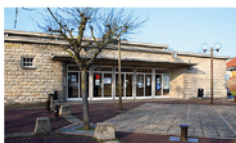
SALLE DES FÊTES DE GISORS

RUE DES LIBERTÉS. SALLE PRINCIPALE DU FESTIVAL. CAPACITÉ: 350 PERSONNES. STATIONNEMENT PARKING PUBLIC. + SALLE ANNEXE: RENCONTRES, EXPOSITION.