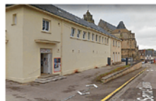
CINÉMA MUNICIPAL JOUR DE FÊTE

RUE DES LIBERTÉS. SALLE PRINCIPALE DU FESTIVAL. CAPACITÉ: 350 PERSONNES. STATIONNEMENT PARKING PUBLIC. + SALLE ANNEXE: RENCONTRES, EXPOSITION.