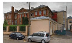
LYCÉE LOUISE MICHEL

4, RUE SAINT-GERVAIS. FILMS HORS COMPÉTITION. CAPACITÉ: 78 PERSONNES. PARKING PUBLIC À PROXIMITÉ.