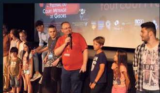
Festival du court métrage de Gisors

Lieu du Festival Salle des fêtes de Gisors rue des Libertés, 27140 Gisors