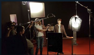
Création / Ateliers / Sorties