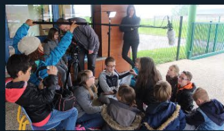
Aide aux structures